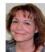
Isabelle DESTELLE Communication - Site WEB